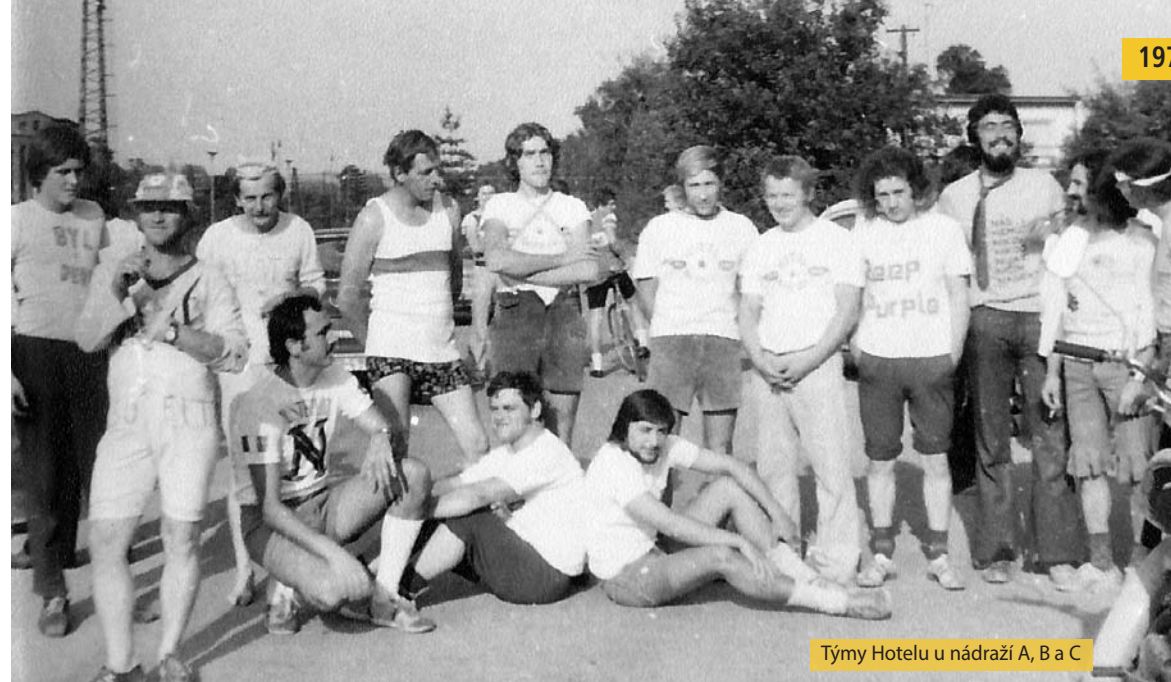
Týmy Hotelu u nádraží A, B a C