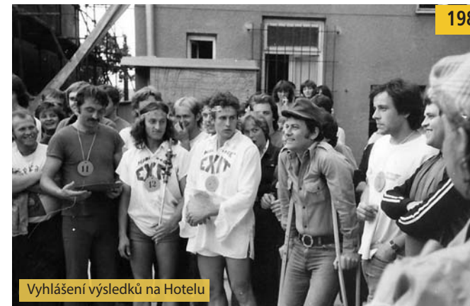
Vyhlášení výsledků na Hotelu